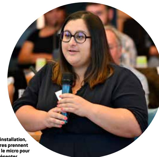
Lors de l'installation, les membres prennent tour à tour le micro pour se présenter