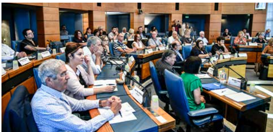
Le 21 septembre 2019 le Conseil vit ses premiers instants avec l'installation des membres citoyens