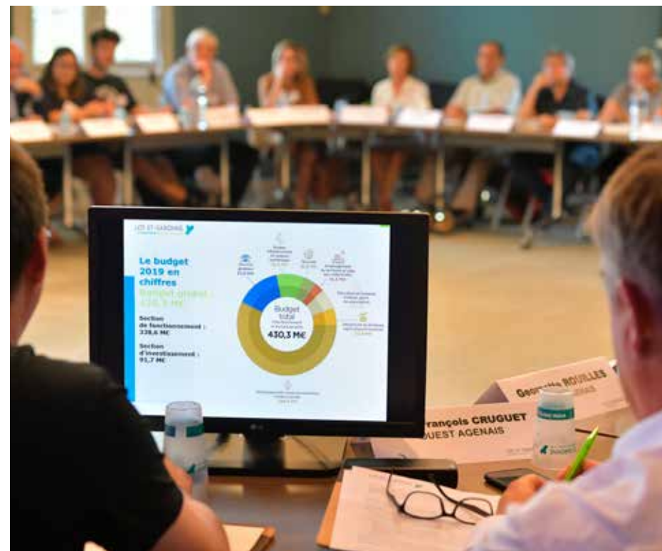
Les membres citoyens s'informent, débattent et échangent autour de sujets qui leur sont présentés

En pratique, les conseillers se réunissent, à un rythme qu'ils définissent eux-mêmes en début de mandat, pour :