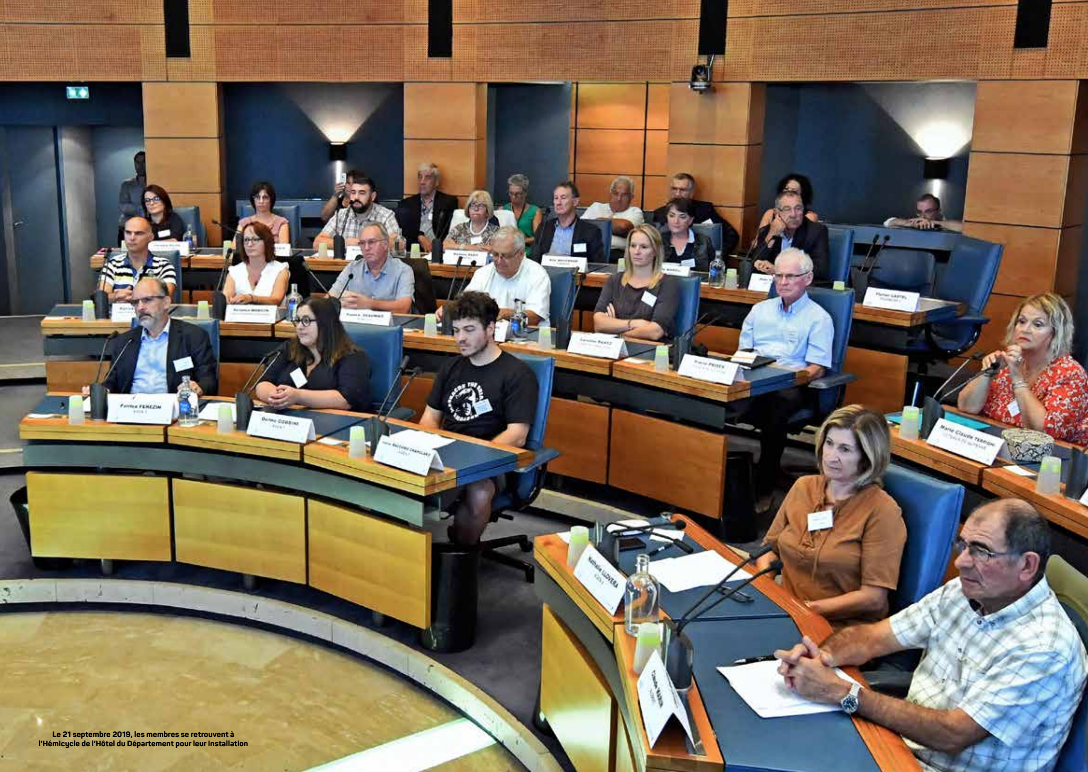
Le 21 septembre 2019, les membres se retrouvent à l'Hémicycle de l'Hôtel du Département pour leur installation